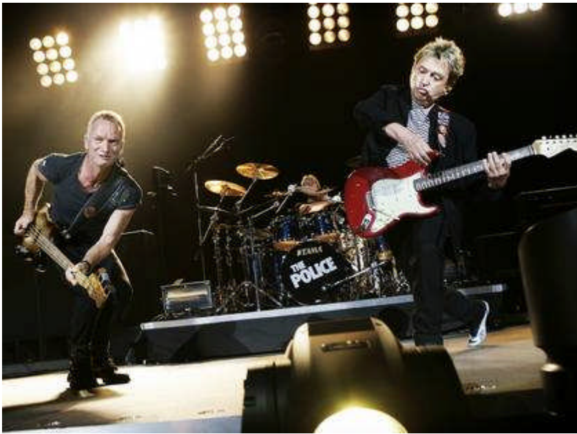
Police år 2007 låter som en less orkester utan elektricitet. De vill inget, och de åstadkommer noll.