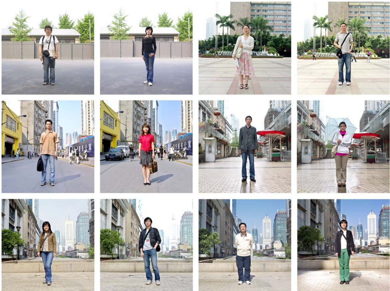
Ai Weiwei, Fairytale People , ett urval, 2007

deras vistelse. En gammal lagerlokal i utkanten av Kassel gjordes i ordning som sovsal. Ai Weiwei skapade en design som med hjälp av draperier delade in lokalen i mindre sektioner som tillsammans kunde härbärgera 200 personer samtidigt. Varje sektion inreddes med bambumattor, sängar och för projektet speciellt framtagna sängkläder. Bakom ett draperi i anslutning till varje säng stod en antik kinesisk stol som deltagarna kunde använda som nattduksbord. På nedre plan på Magasin 3 visas en sektion av sovsalen och dess inredning tillsammans med ett urval deltagarporträtt och filmen som dokumenterar projektet.