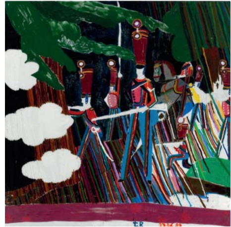
Vänster: Cosima von Bonin, Hermit Crab in Fake Royère , 2010 Mitten: Per Kirkeby, Herbst-Anastasis I , 1997 Höger: Tal R, Old Confused Gun , 2009