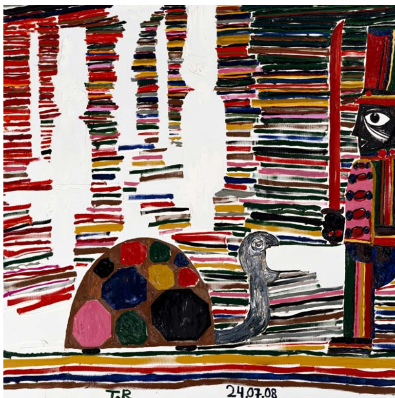
Vänster: Tal R, Hyacinth , 2008 Höger: Tal R, Fast Turtle March , 2008