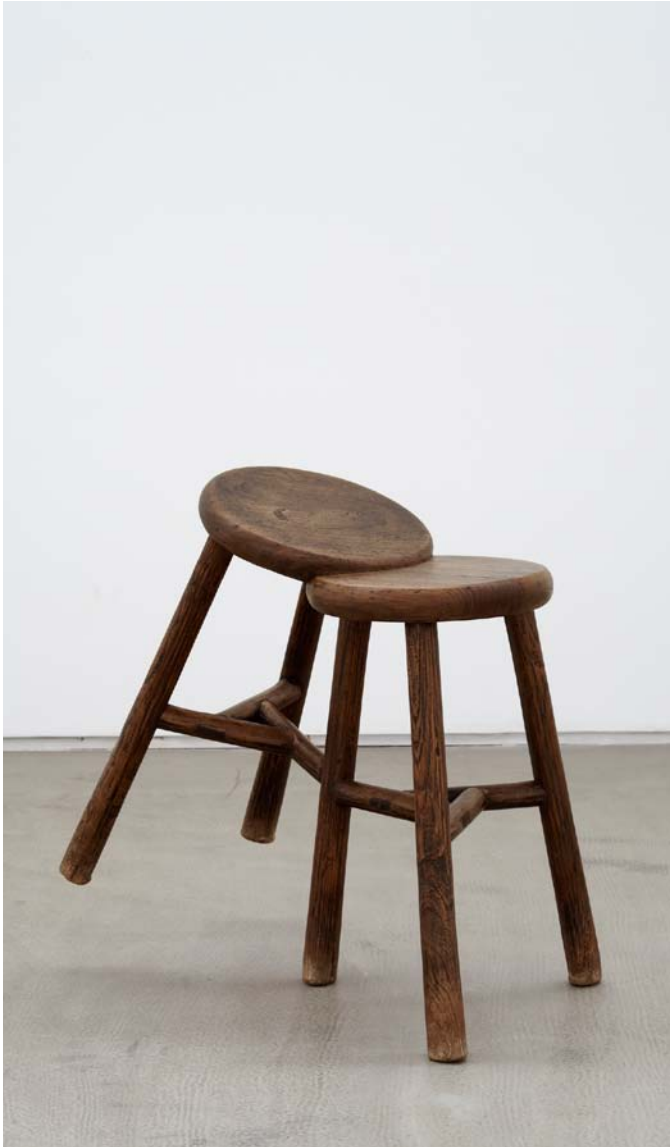
Ai Weiwei, Stool , 2008