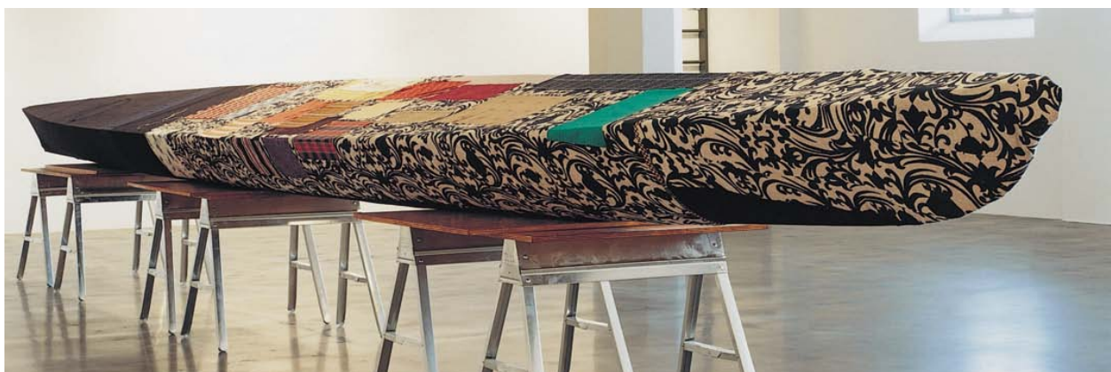
Cosima von Bonin, Item , 2001

Bygg ditt eget museum via facebook. Vad skulle du visa? http://www.intel.com/museumofme/r/index.htm