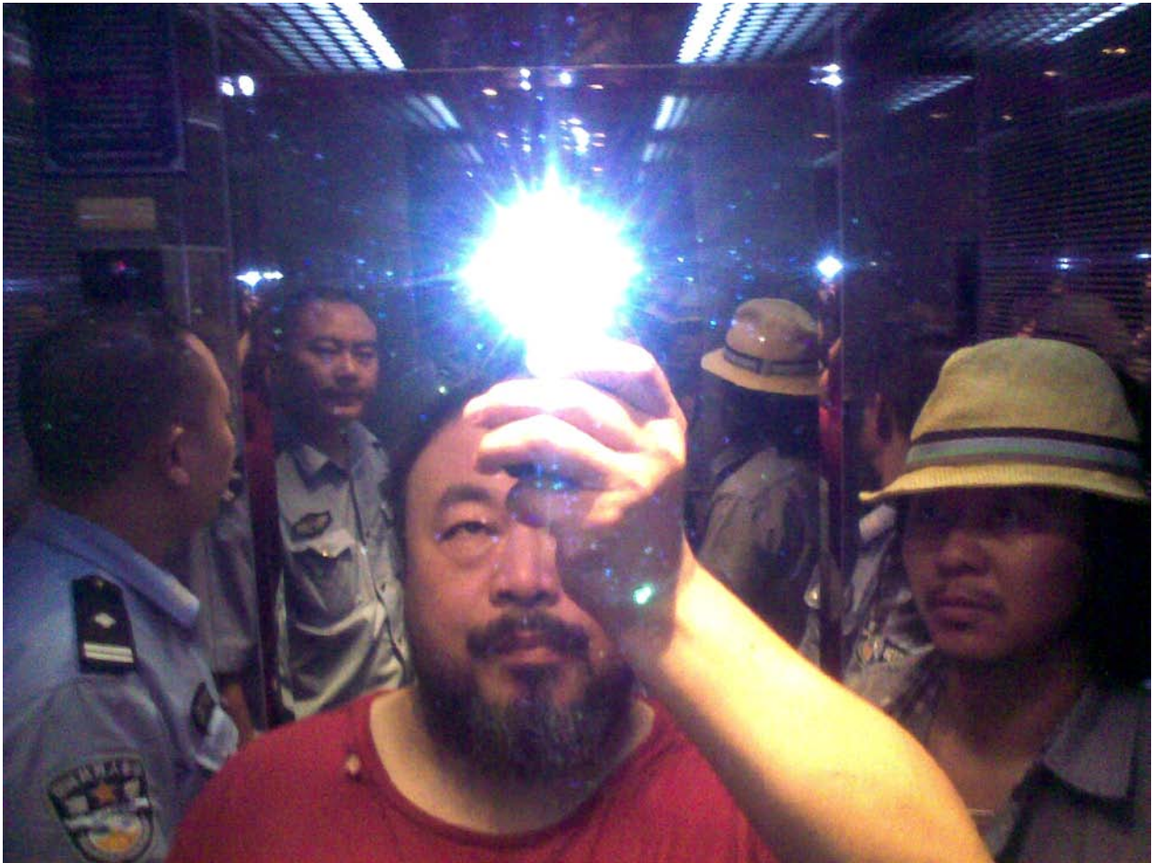
Ai Weiwei, 12 augusti 2009, Ur blogg-fotografier, 2005–2009