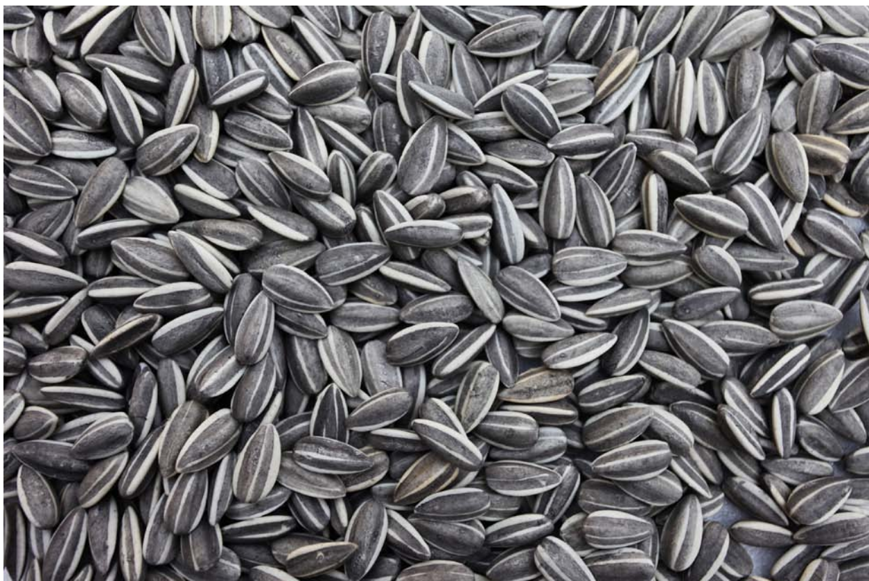
Ai Weiwei, Sunflower Seeds , detalj, 2009

Ai Weiwei vände sig till invånarna i Jingdezhen och gav dem i uppdrag att med hjälp av gamla hantverkstraditioner producera solrosfrön till hans konstverk. Totalt har 1600 personer under 2,5 år varit engagerade i att ta fram miljontals solrosfrön. Varje porslinfrö har individuellt bemålats med det karakteristiska svarta mönstret. Med verket kommenterar Ai Weiwei Kinas plats i världen som synonym till massproduktion och