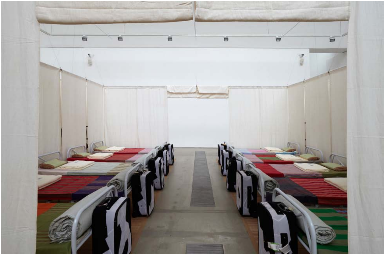
Ai Weiwei, Fairytale Dormitory (1 enhet), 2007

och med olika bakgrund att utan kostnad resa till Kassel under utställningsperioden. I grupper om 200 personer spenderade de en vecka i staden, kunde besöka en unik konsthändelse och samtidigt bli en del av den.