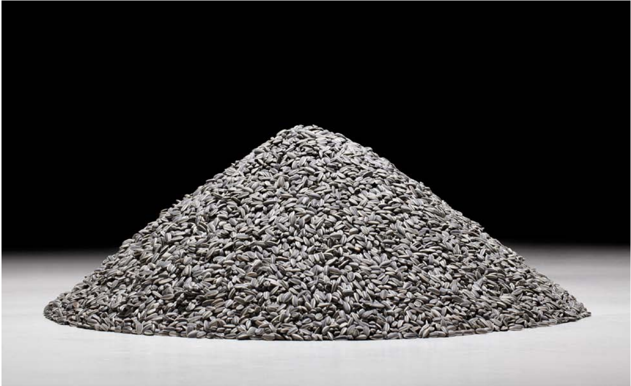
Ai Weiwei, Sunflower Seeds , 2009