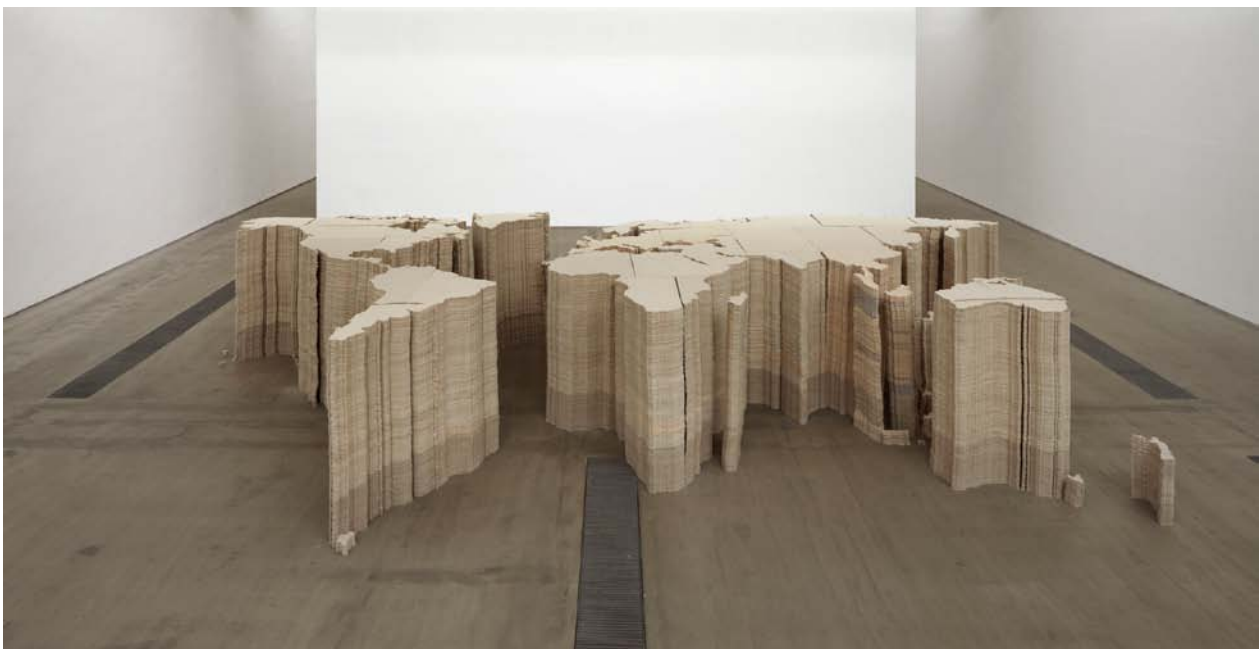
Ai Weiwei, World Map , 2006–2009

Diskutera vad man associerar till begreppet "Made in China".