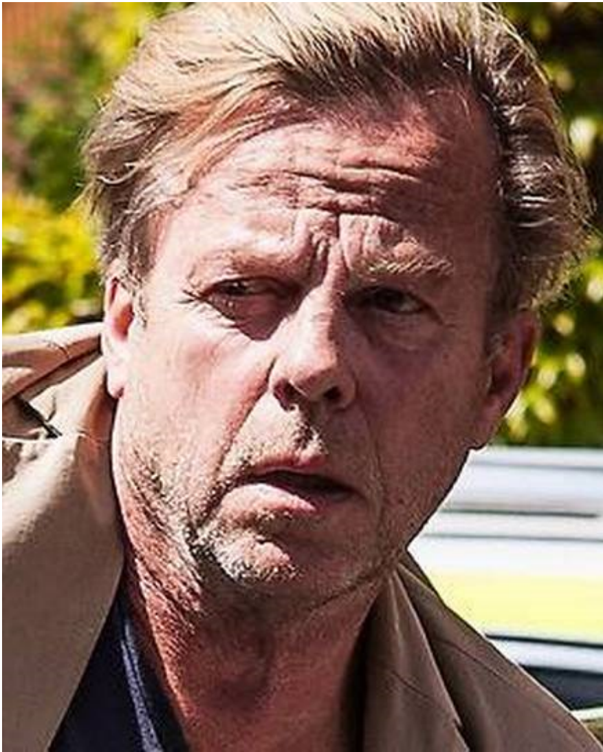
Krister Henriksson har spelat Wallander.