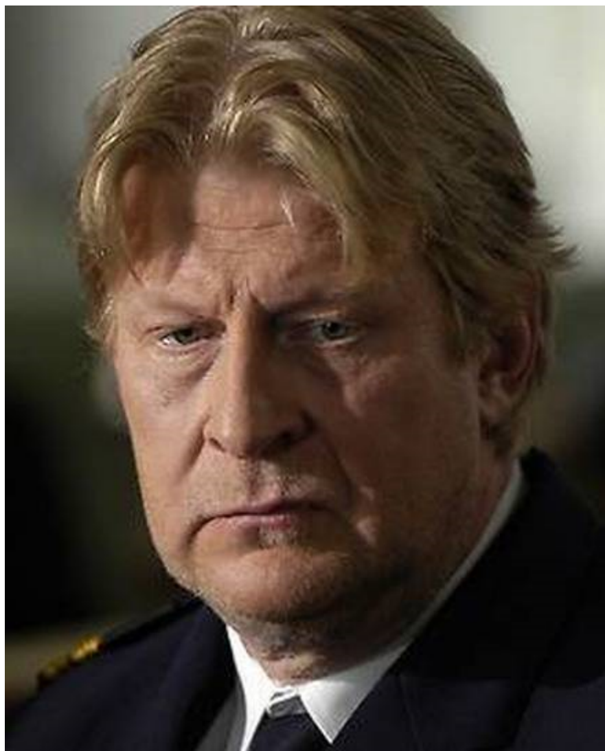
Rolf Lassgård har spelat Wallander.