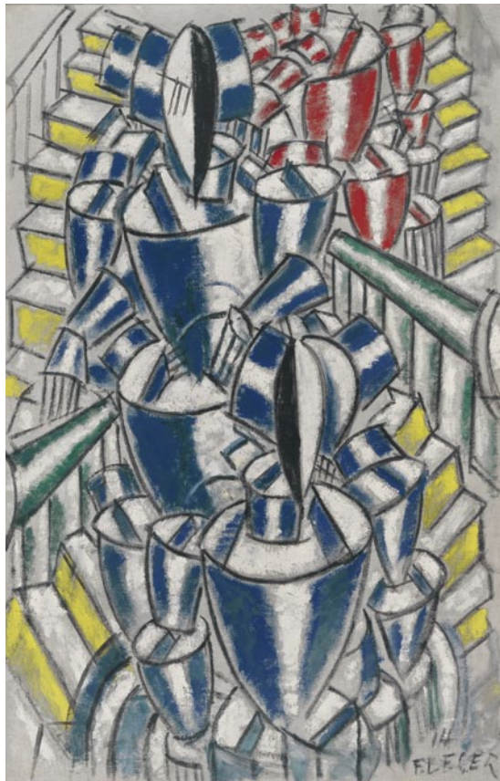
Fernand Léger, Trappan , 1914

Målningen Trappan gjordes just före första världskrigets utbrott. En av inspirationskällorna var Ryska baletten och dansarnas sorti nerför en trappa under en föreställning. Trappan präglas av dynamik, kraft och energi. Genom att kontrastera några enkla former, målade i blått, gult och rött, skapas intrycket av figurer som tycks röra sig ner för en trappa och ut ur bilden. Légers vän konstnären Nils Dardel lyckades förvärva målningen under det brinnande första världskriget för Rolf de Marés räkning.