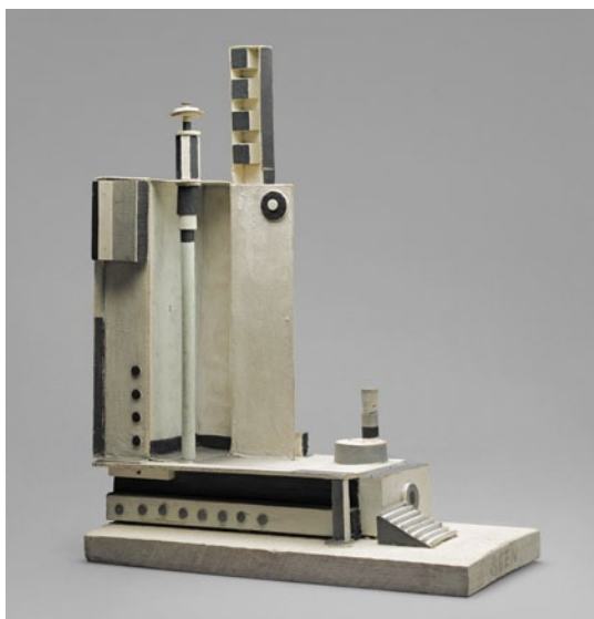
Gösta Adrian-Nilsson, Scen , ca 1925