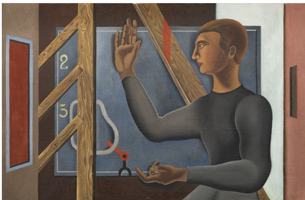
Erik Olson, Konstruktören , 1925 © Erik Olson/BUS 2014

Också den mänskliga kroppen liknades vid en maskin. I uppbrutna collage och målningar skildrade konstnärer som Francis Picabia,