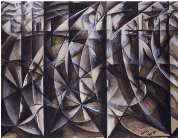
Giacomo Balla, En bils hastighet + ljus , 1913

I det futuristiska manifestet hyllades kriget. Ironiskt nog dog två av de ledande futuristerna i första världskriget och efter krigsslutet klingade rörelsens kraft av. Filippo Tommaso Marinetti, futurismens litterära förgrundsgestalt, kom att stödja Mussolinis fascistiska ideologi. Allt detta har bidragit till futurismens skamfylade rykte. I Sverige använde Gösta Adrian-Nilsson, GAN, futurismens bildspråk och kraft i sina skildringar av färgstarka vaktparader och muskulösa sjömän.