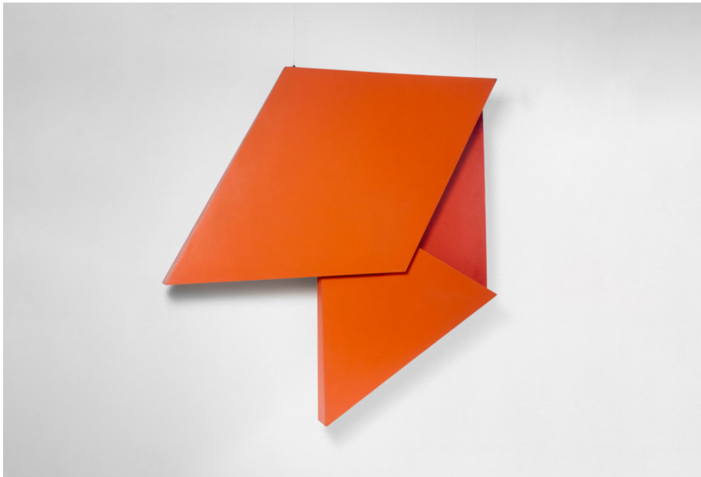
Hélio Oiticica, Sem título (de la serie Relevos espaciales) (Utan titel (från serien Reliefer i rummet)), 1959 rekonstruktion 1991 © César and Claudio Oiticica.