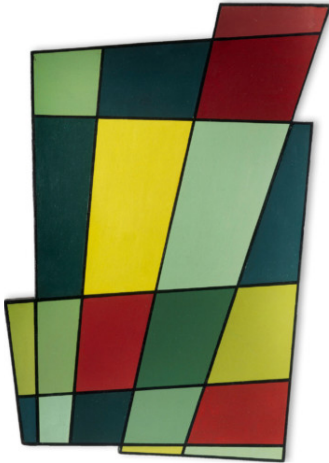
Juan Melé, Marco recortado N° 2 (Oregelbunden ram nr 2), 1946 © Juan Melé