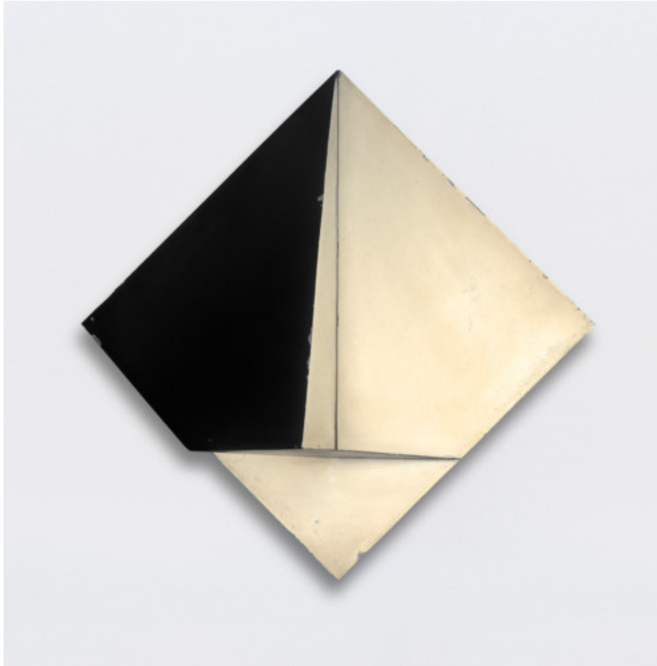
Lygia Clark, Casulo No. 2 (Kokong nr 2), 1959 © Lygia Clark