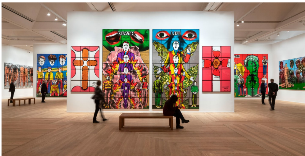
Installationsbild ”Gilbert & George: The Great Exhibition” Moderna Museet 2019.

demokratisk, generös och extravagant som dess skapare. Gilbert & George förespråkar ”konst för alla”.