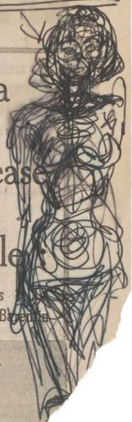
Alberto Giacometti, Huvud i profil och stående naken kvinna, ca 1963. Collection Fondation Giacometti, Paris © Estate of Alberto Giacometti / Bildupphovsrätt 2020