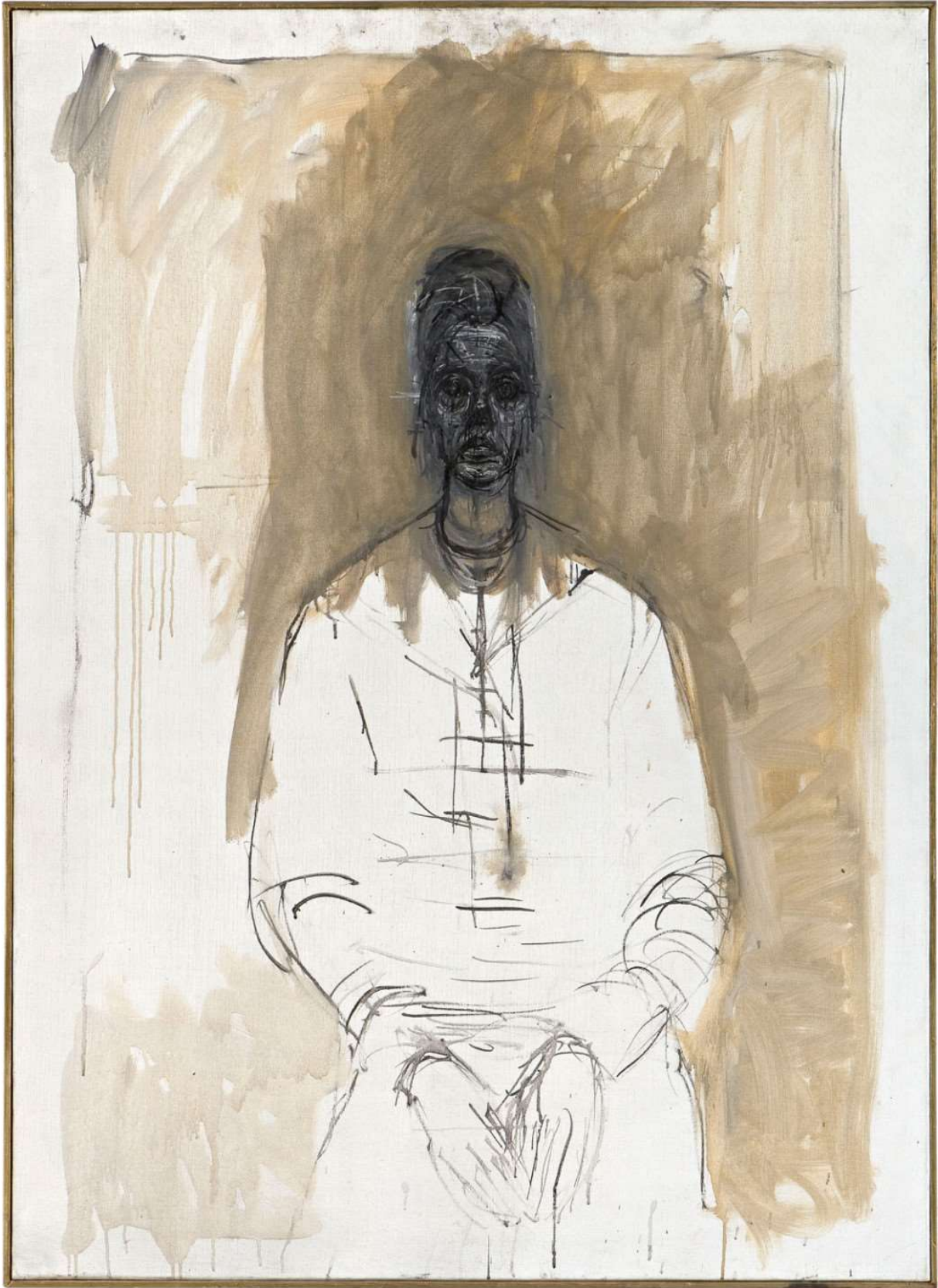
Alberto Giacometti, Caroline en larmes , 1962. Collection Fondation Giacometti, Paris © Estate of Alberto Giacometti / Bildupphovsrätt 2020