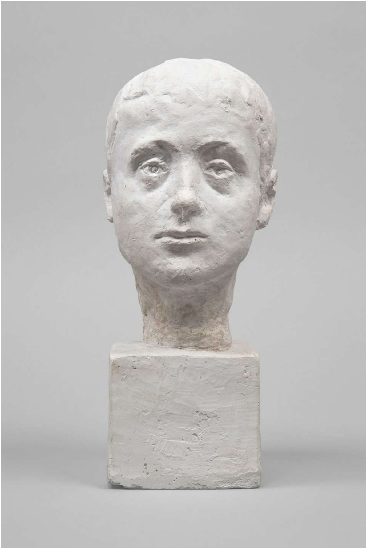
Alberto Giacometti, Huvud, Diego som barn, ca 1914–15. Collection Fondation Giacometti, Paris © Estate of Alberto Giacometti / Bildupphovsrätt 2020