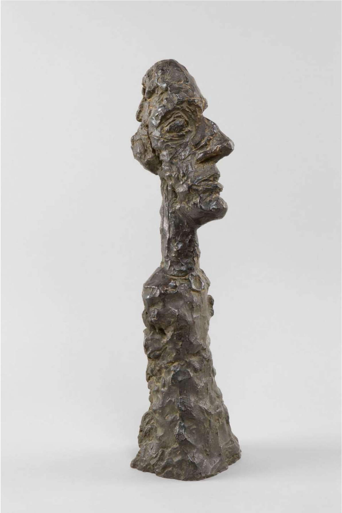
Alberto Giacometti, Huvud med stor näsa, 1958. Collection Fondation Giacometti, Paris © Estate of Alberto Giacometti / Bildupphovsrätt 2020