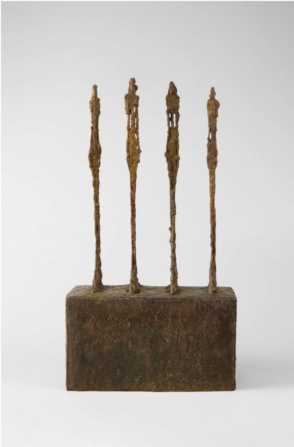
Alberto Giacometti, Quatre femmes sur socle/Fyra kvinnor på sockel, 1950. Collection Fondation Giacometti, Paris © Estate of Alberto Giacometti / Bildupphovsrätt 2020