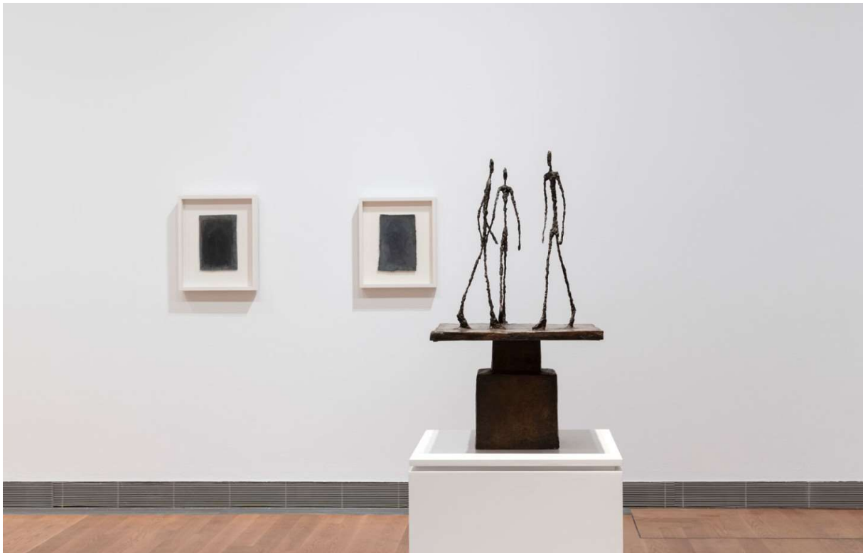
Installationsbild "Giacometti – Ansipte mot ansikte", Moderna Museet, 2020. Foto: Åsa Lundén / Moderna Museet © Estate of Alberto Giacometti / Bildupphovsrätt 2020